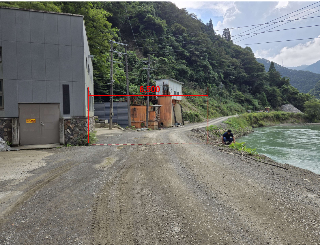
発電所建屋前道路