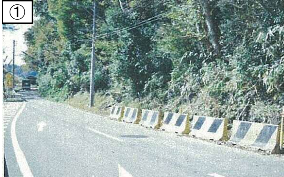
①国道265号線(矢立地区) 法面崩壊、落石の恐れがあり危険