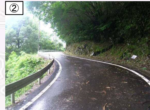
幅員が狭く、児童と車が輻輳し危険