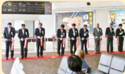
▲各市町村長によるテープカット

私のフェイスブックページ 『fb.com/otsuruchan.shiiba』もみてね♪