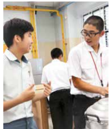
▲身振り手振りで気持ちを伝えます