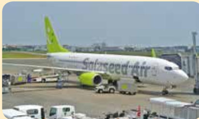
▲今回就航した『天孫降臨ひむか共和国』