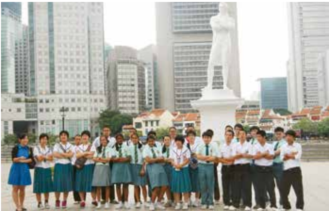
▲シンガポールの創始者トーマス・ラッフルズ像前で記念撮影

7月29日から8月2日までの5日間、「アジア友好の翼」事業で椎葉中学校3年生15人がシンガポールへ海外研修に行きました。 シンガポールでは、ボンゴルセカンドリースクールとの交流を中心に、ホームステイをしたり、観光地に行ったりしました。慣れない海外で大変だったでしょうが、一生忘れることのない良い思い出になったと思います。