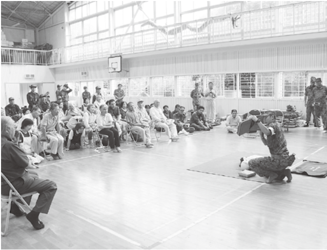
▲自衛隊員による救命講習

また、自衛隊員による救命講習や救助活動で使用する器具の紹介もあり、参加された皆さんは真剣な表情で話を聞いていました。