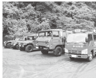
▲消防・自衛隊車両の展示