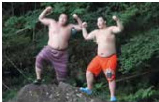
▲(上)平寿園を慰問 (下)岩の上でポーズ!