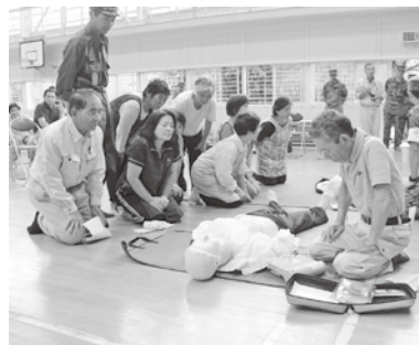
▲皆さん真剣に取り組んでいます