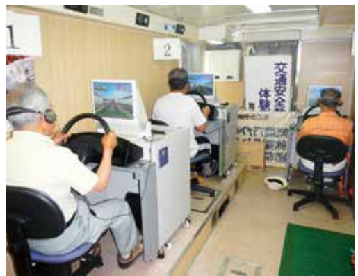
▲シミュレーターで安全運転診断