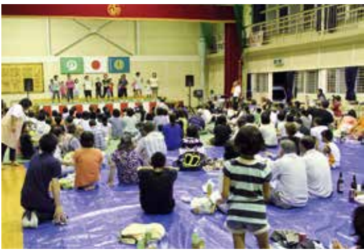
尾向溪谷まつり (8月15日)