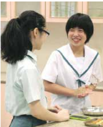
▲笑顔でおしゃべり