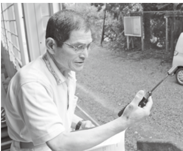
▲衛星携帯電話を使用した通信訓練