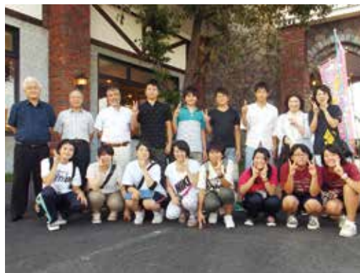
▲県南地区の参加者