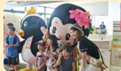
▲子どもたちと記念撮影