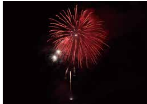
しいば花火大会 (8月18日)