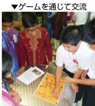
▼ゲームを通じて交流