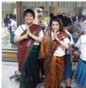
▲民俗衣装を着せてもらいました