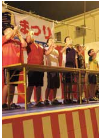
小崎夏まつり (8月13日)