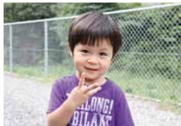
平成23年9月8日生まれ