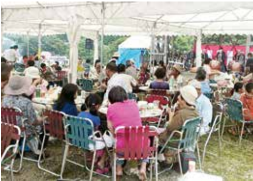
矢立高原 フェスティバル (8月23日)