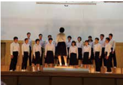
▲演劇、合唱など素晴らしい発表でした。