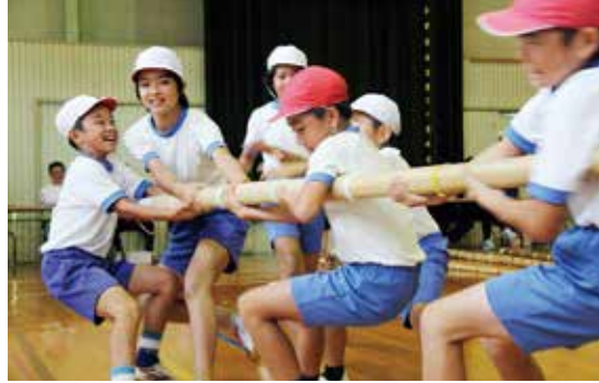
大河内小学校 (9月29日)

村内の小学校で運動会が開催されました。 走って、踊って、子どもたちが大活躍でした!