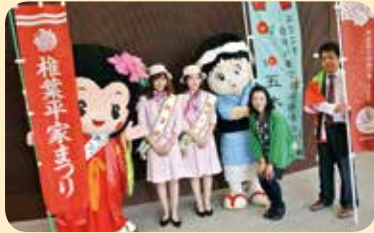
▲五木村のいつきちゃんと一緒に!