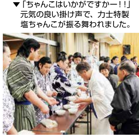
▼「ちゃんこはいかがですかー！！」元気のいい掛け声で、力士特製塩ちゃんこが振る舞われました。