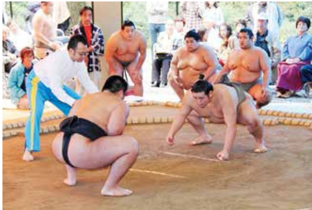
▲迫力ある取り組みに息を飲みました。