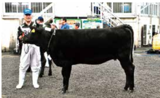
▲株式会社尾前牧場(矢立) しいば157号 (美穂国×忠富士×福桜)

10月23日、都城市で開催された宮崎県畜産共進会で、東臼杵郡代表として出場した本村の2頭が高い評価を得ました。