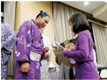
▲力士と子どもたちのふれあいイベント。力士スタンプラリー！力士たちとたくさんお話できました。

今回の3日間合宿で、たくさんの方が力士とふれあい、相撲ファンになったのではないかと思います。椎葉で合宿を行った力士たちが、これからどんどん強くなって、関取になる日が待ち遠しいですね。