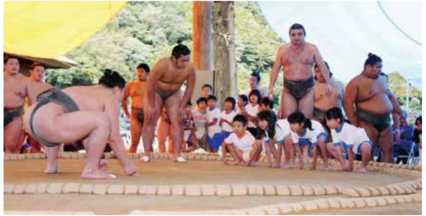
▲体の大きな力士とかわいい子どもたちの対戦！