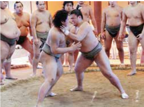
▲厳しい朝稽古 力士の体から汗で湯気が出ていました。