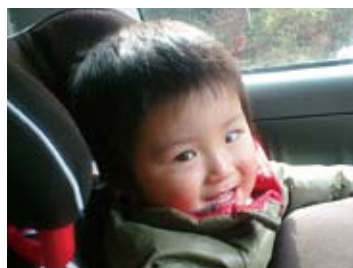
平成22年3月26日生まれ