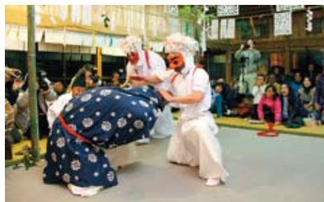
▲猪と猪取り爺の攻防がおもしろい