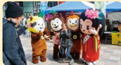
▲みやざきweeeekイン福岡でみやざき犬と。