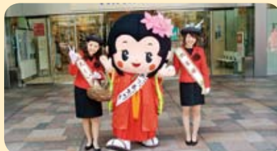
▲観光レディのお二人と椎葉のPRをがんばりました!