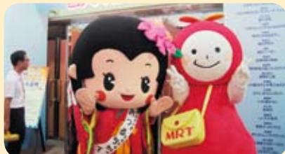
▲ご当地グルメコンテストでMRTのミーモちゃんと。