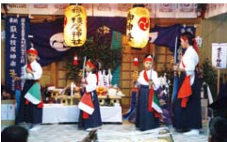
▲かわいい舞手が登場！