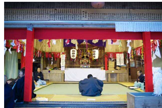
人、神、生き物、全てへの感謝