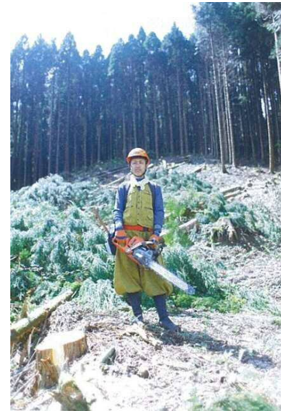
自然に寄り添って生きる