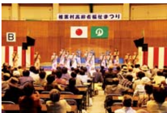
■ 高齢者福祉まつり