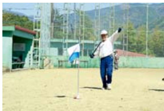
■ グラウンドゴルフ大会