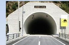
岩尾トンネル 延長 571m 掘削工法 NATM工法

道路規格 道路の区分：3種4級 設計速度：50km/h 幅員：5.5(7.0)m