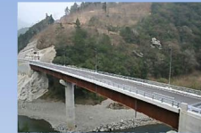
岩尾大橋 橋長 115m 橋種 鋼2径間連続非合成版桁橋