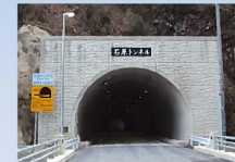
石原トンネル 延長 232m 掘削工法 NATM工法