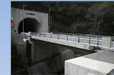
石原谷橋 橋長 19m 橋種 PC単絨ボステン中空床版橋