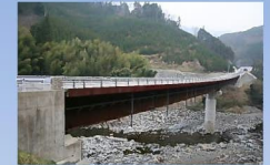
春大橋 橋長 130m 橋種 鋼2径間連続少敷桁橋