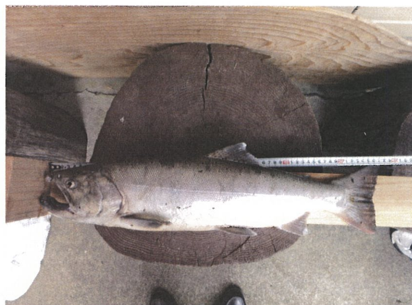
57cm2mm昨年度優勝の平家マスです。