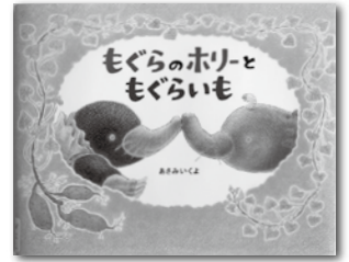
『モグラのホリーともぐらいも』 （偕成社） 著／あさみ いくよ

もぐらともぐらにそっくりの形をしたサツマイモの話。へんてこな友だちですが心温まる絵本です。みなさんいろいろな友だちをつくってください。