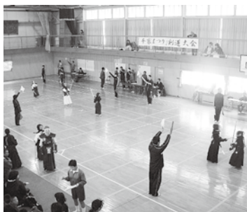
▲高千穂高校剣道部の皆さんに 審判などの大会運営をご協力 いただきました