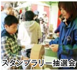
スタンプラリー抽選会