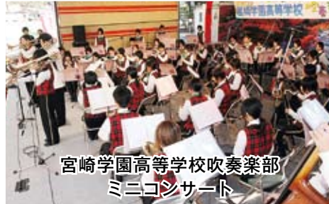
宮崎学園高等学校吹奏楽部 ミニコンサート