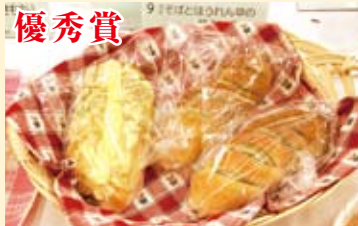
「そばとほうれん草の仲良しパン」 グループひえつき (尾八重)