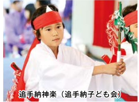
追手納神楽 (追手納子ども会)