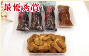
「あくまき」 山ゆり会 (川の口)