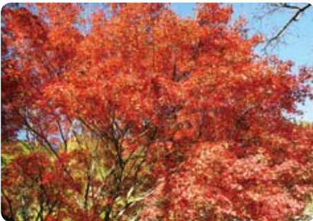
▲真っ赤にもえるモミジ。車を止め、記念撮影をする光景をよく見かけます（11月24日・女神像公園）

10月下旬、見頃を迎えた椎矢峠の紅葉。標高差のある村内を、黄金色や真っ赤なモミジが広がります。