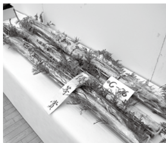
▲根菜の部の優等品 立派な自然薯（山芋）