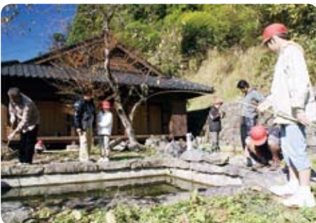
▲ご飯粒をエサにヤマメ釣り。中には一人で何匹も釣り上げる児童も（11月15日・十根川）

椎葉小の4年生9人が十根川地区へ。八村杉と大久保のヒノキを見学し、古民家公開施設で魚釣り。