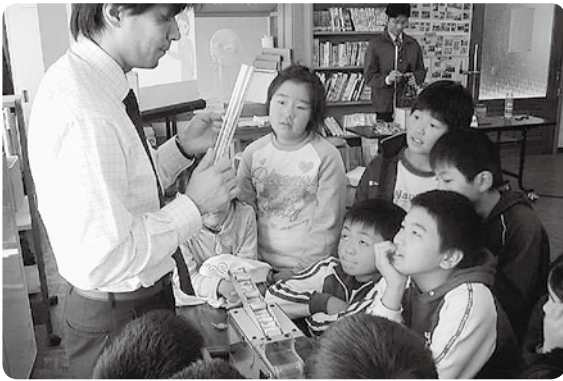
▲間近で見る実験は驚きの連続です

11月15日、尾向小学校で「環境教育教室」が行われました。これは(株)シャープとNPO法人 気象ネットワークが全国の学校を対象に実施しているもので、この日も、地球温暖化やりサイクルの仕組みについて詳しく学習しました。また、実験もあり、渦電流によって、銅製のパイプがUFOのようにゆらゆらと落ちていくマグネットを見て歓声をあげていました。 今回の授業で、自分たちでもできる省エネに取り組むことの大切さもしっかりと学ぶことができました。