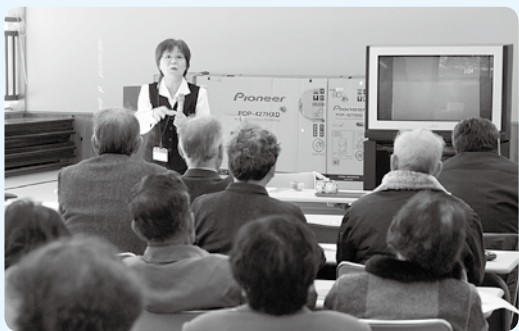
▲11月22日、県消費者センターの啓発員による講話(すこやか館)