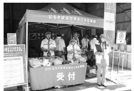
▲JTと村環境美化推進員による運動。二日間で延べ約1400人が参加し、69袋分のゴミを回収。「街がきれいになった」と大好評