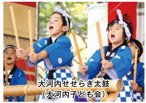
大河内せせらぎ太鼓 (大河内子ども会)