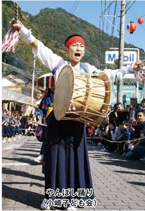
やんぼし踊り (小崎子ども会)