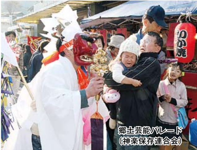
郷土芸能パレード (神楽保存連合会)