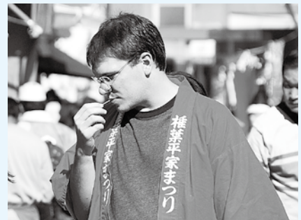
▲初めての食べ物もとてもおいしかったよ (11月10日・椎葉平家まつり)

Coming up for me is a weekend in Fukuoka for the big sumo tournament. I'm pretty excited, both to see the city and to see giants wrestling for control of the center ring. It should be an exciting weekend.