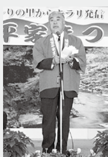
▲平家まつりで歓迎のあいさつ(10日)