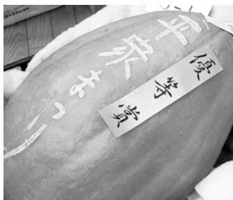
▲飼料カボチャの部 優等品は重さ20.8kg！