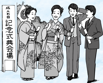
成人日記念式典会場