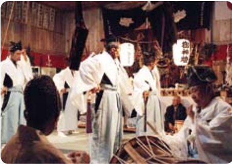
▲夜を徹して行われる「梅尾神楽」。祝子の舞いにせり唄が飛び交います（11月22日・梅尾神社）

村内27地区に伝わり、地区毎に特色のある「椎葉神楽」。梅尾神楽を皮切りに、12月末まで続きます。