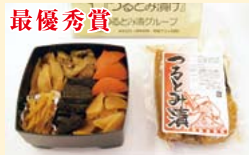
「つるとみ漬」 つるとみ漬グループ (竹の枝尾)