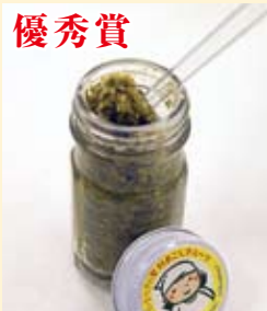
「みずな」 御池の里 (向山)