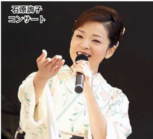
石原詢子 コンサート