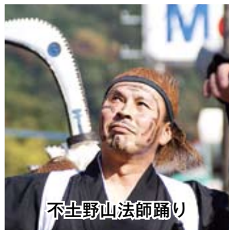
不土野山法師踊り