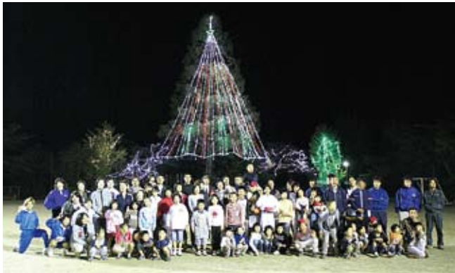
▲11月7日・椎葉小学校グラウンドで点灯式