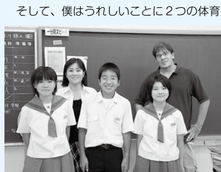
▲松尾中の1年生（9月20日）

皆さんこんにちは。先月から僕は椎葉に住み始めました。おおよそどの店がどこにあるか覚えましたが、その中で調理してある食べ物を手に入れることができる店を今のところ1軒だけ見つけました。8月に比べると気温もだいぶ下がってきて過ごしやすくなってきました。学校も2学期を迎え、僕の教師の仕事が始まりました。これまでの変化は僕にとってちょうどいいペースでした。僕は役に立つ仕事をしているなって一実際そうであればいいけどー実感します。椎中・松中どちらの学校の人々もとても良くしてくれて、僕は着任早々家にいるようにリラックスできました。今のところ、10月に開催される英語のスピーチコンテストに出場予定の生徒の指導が主な仕事になっています。僕は英語の文法や発音を教えています。生徒たちはとても上手になっているので、本番でもきつとうまくいくでしょう。みんなとてもいい生徒だから、これを読んでいる両親たちも子どもたちがすばらしいと知って喜ぶでしょう。今までは何のトラブルも起こってないし、生徒たちはみな明るくて親しみやすい子ばかりです。