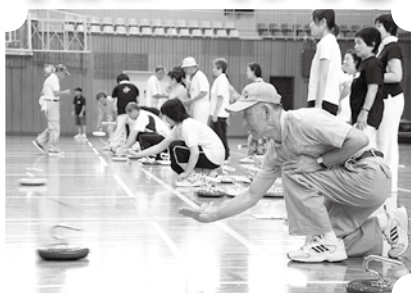
▲カローリングの要領で楽しめます。(8月22日・村体育館)