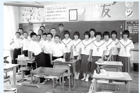
▲椎葉中の1年生（9月11日）

I've had one more new, uniquely Japanese experience as well. I've now tried shochu for myself, and I learned my first word of the local Shiiba dialect: ganburi. I hope I've been saying it right.