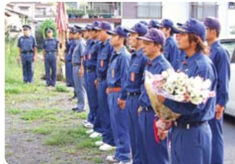
▲集まった消防団の幹部と本部の団員。さらなる防災力向上を誓いました。(9月6日・上椎葉上区)

2年前の土砂崩れ災害現場での追悼式。消防車のサイレンを鳴らし、黙とうで3人の冥福を祈りました。