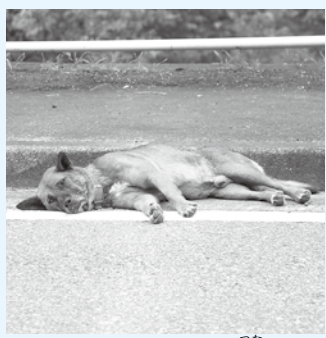
▲道路に寝そべる犬。繫がれないのは犬の責任ではない。