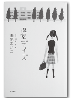
『温室アイズ』 著／瀬尾まいこ(角川書店)

あなたは字は生きてると思いますか？ この本は字を覚えるための本ではなく、字を感じ楽しむ絵本です。筆で書かれた「書」の生命力が感じられます。この本を読むときと何かを感じ取ることが出来ますよ。