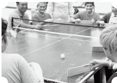
▲歓声を上げ白熱のラリーが続きました。

8月30日、開発センターで障がい者スポーツ教室が行われました。今回の競技は「卓球バレー」で、1チーム6人が卓球台を囲み、木の板のラケットでボールを打ち合うゲーム。バレーのルールも取り入れ、大人数が同時にプレーできることから人気が高まっています。また、午後に行われた「遊書」では、筆を使い思いの言葉を書き、額に収めて持ち帰りました。