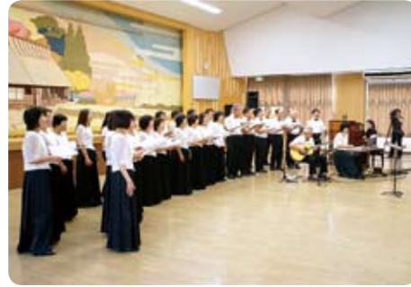
▲「合唱団やまびこ」による愛唱歌。前日には八村杉の下で歌声を披露しました。(8月26日・開発センター)

平成2年の「巨木の里」シンポジウムでの出会いを縁に、佐賀県武雄市から椎葉村へ歌のプレゼント。