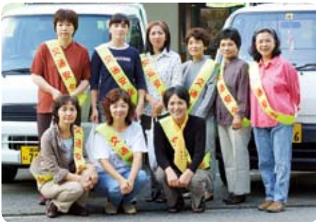
▲街頭キャンペーンではチラシや飲み物を配り、交通安全を呼びかけました。(9月21日・平家本陣前)

スローガンは「交通安全ゆずる優しさ待つゆとり」。飲酒運転の根絶を願い、各地で座談会を実施。