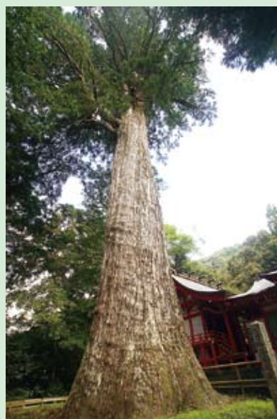
▲天高くそびえ立つ「八村杉」

十根川神社の境内へ入るとすぐに杉とイチイガシの巨木が出迎える。まずはその大きさに感心する。さらに奥へ進み神殿の先を見る。すると、そこにそびえ立つのが「八村杉」。今度はその大きさに驚かされる。単幹では県内最大の巨樹で、50mを超す高さは国内でも最大級。端正な姿が魅力的なこの大杉は、那須大八郎宗久の手植えの杉と伝えられ、椎葉の平家伝説において象徴的な存在ともいえる。