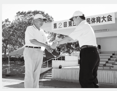
▲郡民体育大会で大会旗の引き継ぎ（2日）