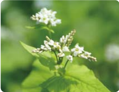
▲ソバの花。村内でよく見かけます。近くで見ると、小さくてかわいい花の集まりです。(川の口営農組合集落)