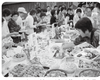
▲たくさん並んだ手作り料理。

また、午後は参加者がそれぞれ持ち寄った地域の手作り料理を囲み、立食でのランチ交流会・飛び込み大歓迎の1分間スピーチなどが行われ、参加者はおいしくて楽しいひと時を過ごすと共に、食の重要性を改めて認識し農業への意欲を新たにしました。