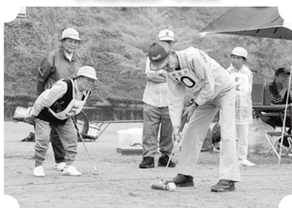
▲決勝戦は上椎葉と竹の八重。(9月13日・村グラウンド)