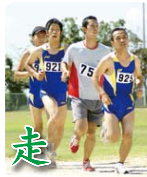
東白杵郡 (門川町・9月2日)