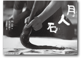
『月人石』 書／乾 千恵(福音館書店)

あなたは字は生きてると思いますか？ この本は字を覚えるための本ではなく、字を感じ楽しむ絵本です。筆で書かれた「書」の生命力が感じられます。この本を読むときと何かを感じ取ることが出来ますよ。