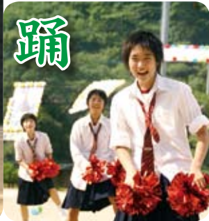
松尾中学校 松尾地区合同 (9月23日)