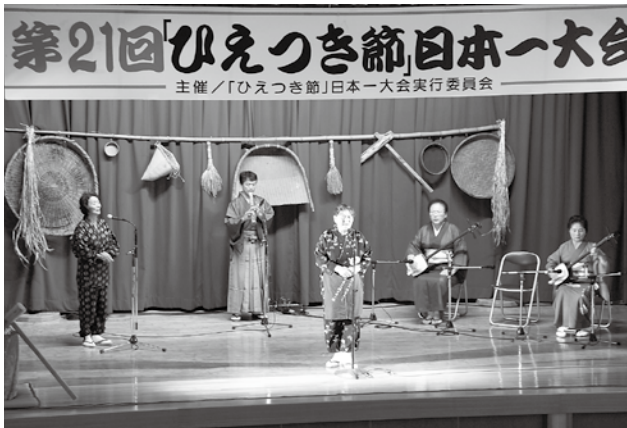
▲尺八と三味線の伴奏に「庭～の山椒お～のお木い～」。