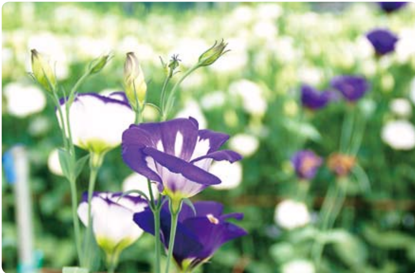
▲一重と八重の花があり、色も白、桃、赤、紫、青紫と様々。 (小崎地区臼杵侯・9月20日)