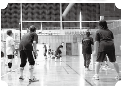
▲ミニバレーとグラウンドゴルフ。(8月26日・村体育館)