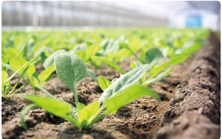
▲収穫前の小さなほうれん草。太陽の光を浴び、大きく葉を広げます。 (矢立宮農団地・9月20日)