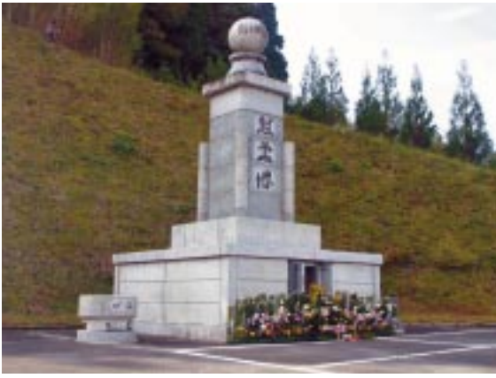
▲椎葉の花々が飾られた戦没者慰霊塔。