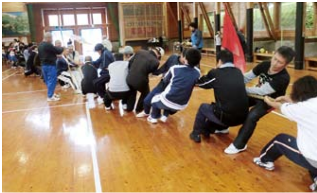
▲あいにくの雨で室内となりましたが、大盛り上がりでした。