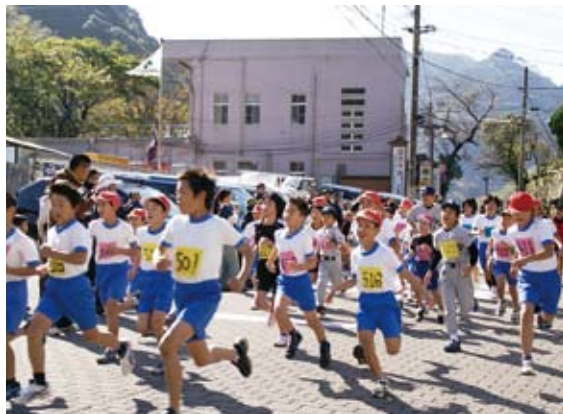
村青年団主催の持久走大会が開催。約90人が参加し、爽やかな秋空の下、気持ちのいい汗を流しました。