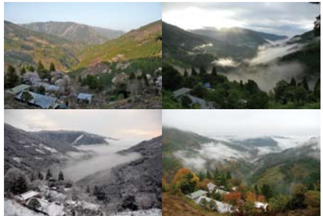
椎葉 吉人 (椎葉村)