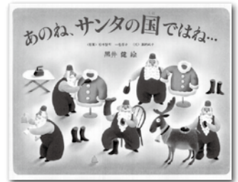
『あのね、サンタの国ではね...』

開発センター ■問い合わせ先 椎葉村教育委員会 ☎67-2850 無料☎767-0081(0082)