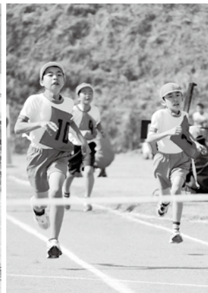
▲最後の力を振りしぼり ラストスパート(小学1000m)