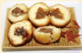
▲つるとみドーナツ