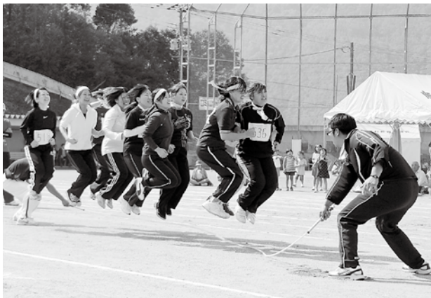
▲圧倒的な強さで勝利の桃団(大縄跳び)