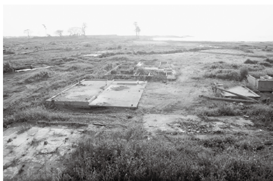
▲元々は建物が建ち並んでいた場所です。建物は津波にさらわれ、基礎が残っているだけでした。

りに出てきた課員の方々はバスが役場 から出るまで手を振ってくださいました。 感涙したのと同時に、自分が山元町役 場総務課の方々と同じ状況で、同じ行 動がとれるか考えました。黙々と自分 のやるべき事を行い、どんな時でも感 謝することを忘れない、日本人の有るべ き姿を見ることができた気がします。 震災の復興は今始まったばかりで す。様々な場所に募金箱は据えられ ています。皆様のご協力をお願い申 上げます。