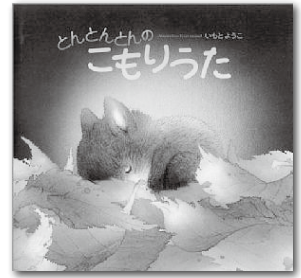
『とんとんとんのこもりうた』 [出版社] 講談社 (作・絵) いもと ようこ

開発センター ■問い合わせ先 椎葉村教育委員会 ☎67-2850 無料☎767-0081(0082)