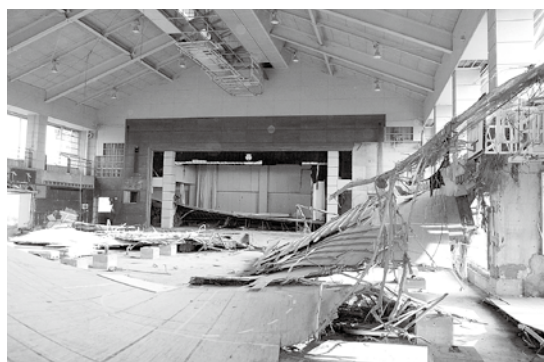
▲学校の体育館です。津波の怖さを目の当たりにしました。