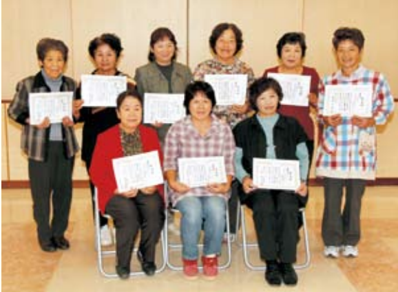
▲受賞された皆さん、おめでとうございます。

主催：椎葉村むらおこしグループ連絡協議会 椎葉平家まつり実行委員会 協賛：椎葉村椎茸部会