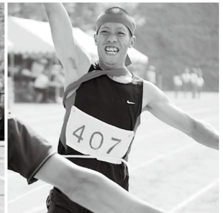
▲男子リレー1位でゴール!(赤団)