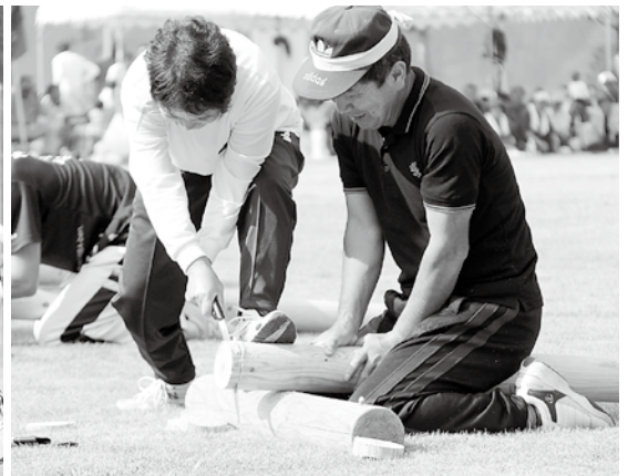
▲公民館対抗「椎葉木挽き」