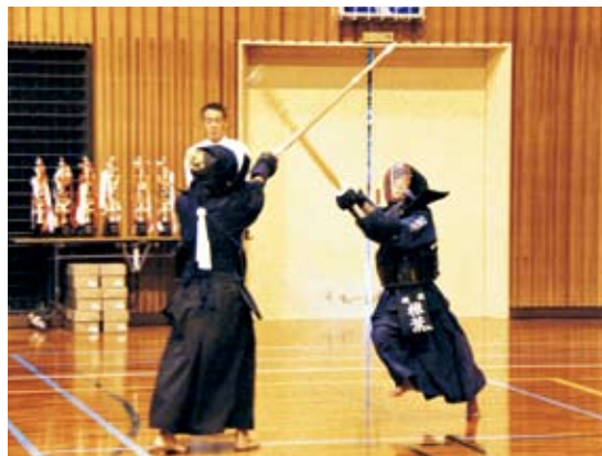
◀上から 3年生の部 2年生の部