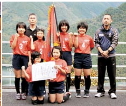
【バレーボールの部】 優勝 椎小フレンスクラブ 2位 松尾少女バレー