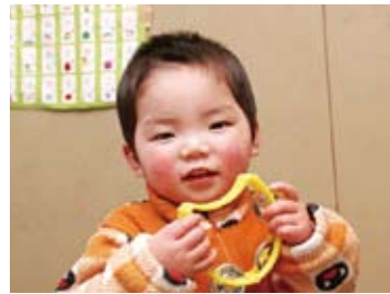
平成21年3月19日生まれ