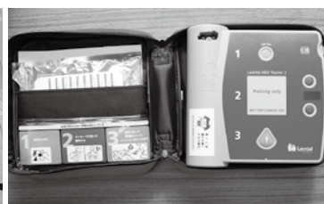
▲AED（自動体外式除細動器）本体

本村では別表の学校施設等にAEDを整備しています。今後、自主防災組織、学校、消防団等が連携して実施する訓練で訓練シミュレータを活用することにより、AEDの正しい取扱いの普及を目指します。