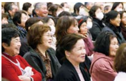
▲講演を聞いているみなさん

「生涯学習」は、村民一人ひとりが主役の、いつでも、どこでも、自由に取り組めるものです。