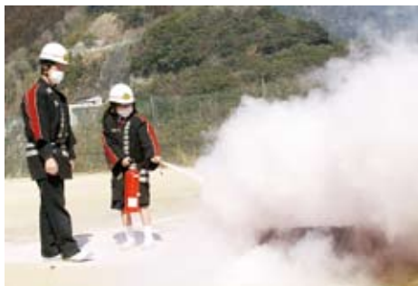
▲消火器訓練、きちんと消火できました