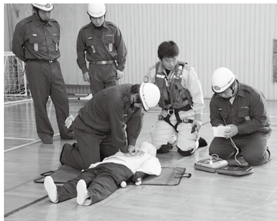
▲AEDを使った心肺蘇生法の訓練