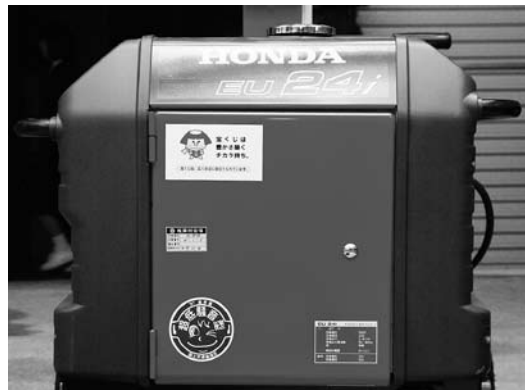
▲本部及び第7部機庫に保管された機材（投光器・発電機）