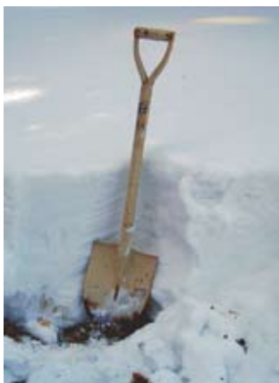
▶ すごい量の雪です!

1月7日、ハウスの屋根に積もった雪かきを農林振興課 農業振興グループ、JA、農家のみなさんで行いました。(向山日添)