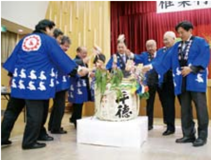
▲口蹄疫被害からの復興、景気回復を願う樽酒の鏡開き

1月11日、開発センターにおいて総勢100人が集まり、椎葉村商工会主催の新春賀詞交歓会が行われました。