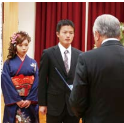
▲村長から成人証書が授与

今回成人を迎えたのは、平成2年4月2日から平成3年4月1日に生まれた男性18人、女性19人の計37人。式には29人が出席し、久しぶりに出逢う友人との会話が弾んでいました。