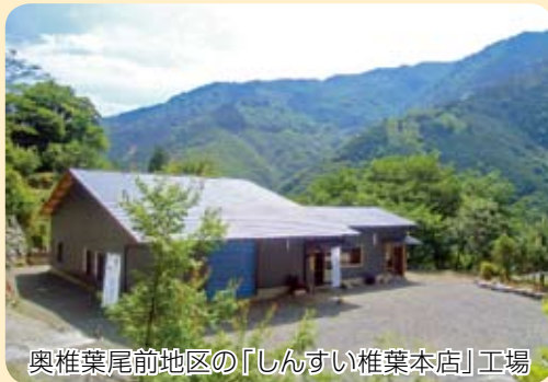
奥椎葉尾前地区の「しんすい椎葉本店」工場