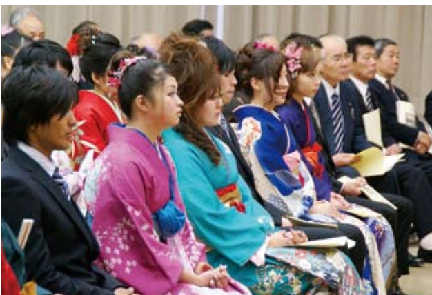
▲講演を熱心に聴いていますね