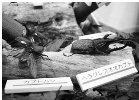
▲標本も多数並び昆虫展

椎葉民俗芸能博物館1階で「椎葉村の動植物たち」を開催中！カブトムシなどのジオラマや、生きものの写真の展示会を行っています。