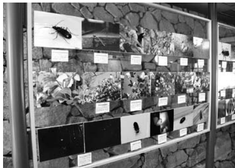
▲椎葉村の動植物たち（写真展）