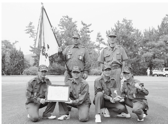
▲準優勝の2部のみなさん

8月1日、日向市のお倉ヶ浜「消防訓練広場」で、第57回日向支部消防操法大会が行われました。椎葉村からは、7月4日の村予選を勝ち抜いた3チームが小型ポンプの部に出場。結果は昨年7位の2部が、優勝チームにあと1点差と迫る健闘を見せ、見事準優勝を獲得。惜しくも椎葉村勢5連覇には手が届きませんでした。来年度の県大会、そして3年後の全国大会へと、今後の活躍に期待のもてる結果となりました。