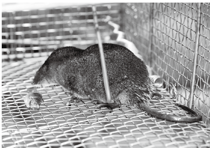
▲アブラメ(タカハヤ)のおとりで捕獲されたカワネズミ (8月29日) 松尾・唾谷川(鳥の巣谷)