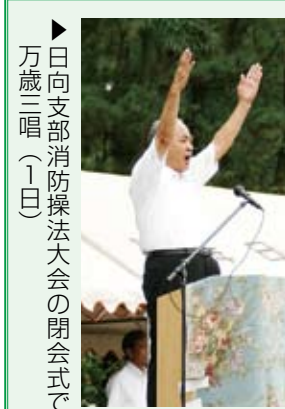
▶日向支部消防操法大会の閉会式で万歳三唱(一三日)