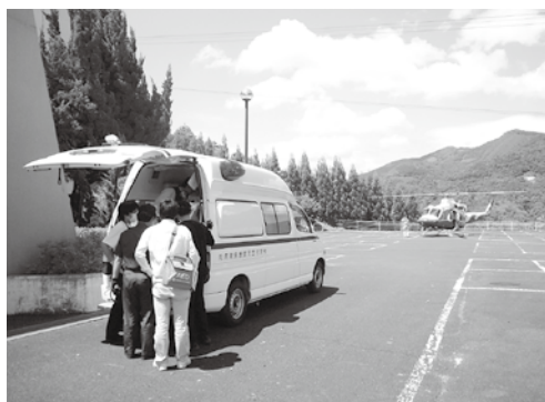
▲事故で運ばれた患者を防災ヘリ「あおぞら」へ (5月29日・村体育館)