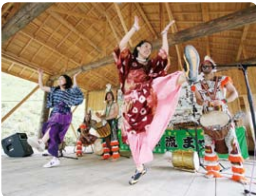
▲アフリカ太鼓のリズムに合わせ、会場全体に広がった軽快なダンス