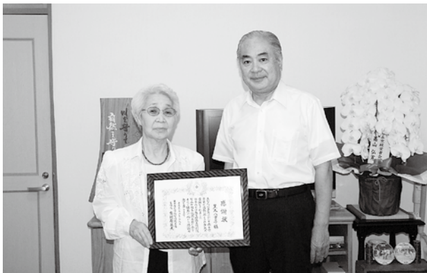
▲村長からも感謝 ねが と労いの言葉が伝えられました。(7月15日・村長室)

元気発信! 「いきいき集落」 7月14日、役場で「いきいき集落」認定証交付式が行われました。「いきいき集落」とは、県が「限界集落」に替わる明るい呼び名として、全国から募集し決められた言葉。中山間地域において、住民主体の元気な地域づくりに取り組む集落が、申請により県の認定を受けました。 今回村内から、梅尾地区、川の口・十根川・大久保・下椎葉集落の5ヶ所が認定されました。地域の明るく元気な活動を応援します。