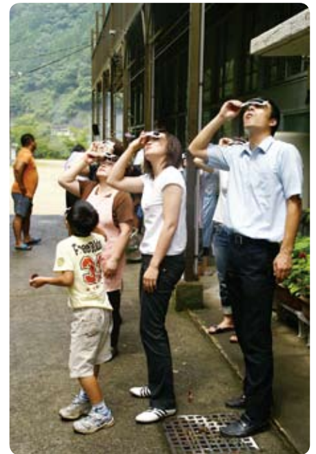
▲曇り空が程よいカーテン。日食グラス越しの太陽観察（松尾中学校）