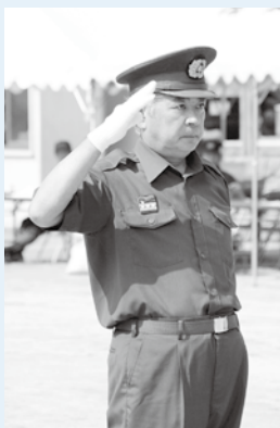
▶消防操法大会で点検長(4日)