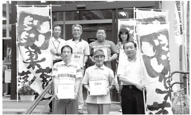
▲みなさんへ手渡されたのぼり。各地区の目印となります。

郡民大会で優勝を! 8月23日に諸塚村で開催される郡民体育大会。3年ぶりの優勝へ向け、結団式が行われました。