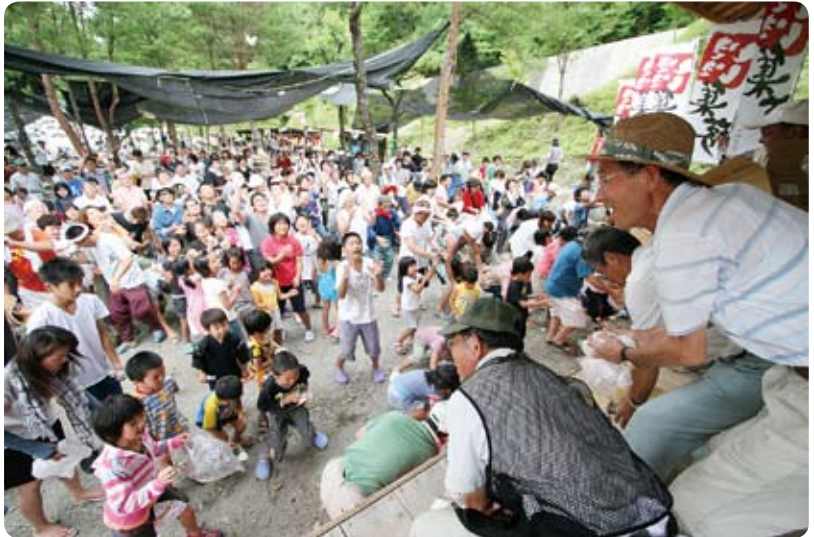
▲お楽しみ抽選会が終わり最後の餅まき。見つめる姿は真剣そのもの