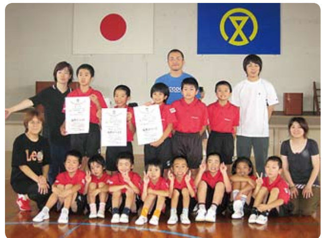
▲来年はさらに上位を！ 賞状を手にみんな笑顔（7月12日・宮崎市）