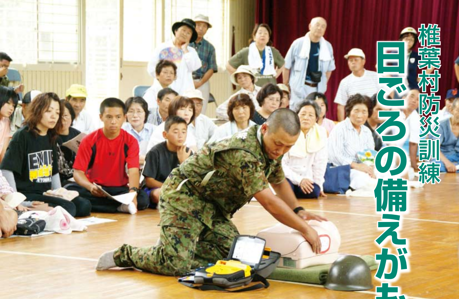
▲陸上自衛隊の隊員による人命救助訓練。人形とAED（自動対外式除細動器）を使用しての心肺蘇生法（7月19日・松尾小学校体育館）