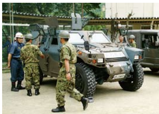
▲一台2千4百万円の自衛隊特殊装備車両。災害時等に威力を発揮します。

あの日の出来事を決して忘れることはできません。平成17年9月の「台風14号」。未曾有の被害をもたらした。3人の尊い命を奪いました。あれから4年。災害復旧を終え、元の生活をほぼ取り戻すことができました。しかし、各地に残る爪跡。心に刻まれた思い。そしてまた、いつ起こるのか予想もできない台風災害。今、改めて高い防災意識が求められています。「もしも」の時にこそ、日ごろの備えがものを言います。