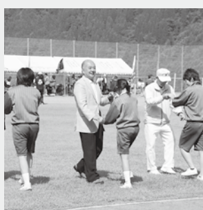
▲村民体育大会でフォークダンスに参加(12日)