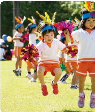
▲元気にジャンプ！上椎葉児童館と鹿野遊保育所の子どもたちが、歓迎アトラクションでかわいいダンス