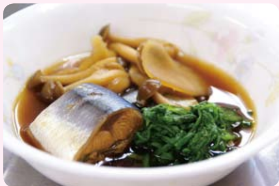
【栄養成分】※1人分 エネルギー：206kcal たんぱく質：12.6g 脂質：14.9g 塩分：1.2g