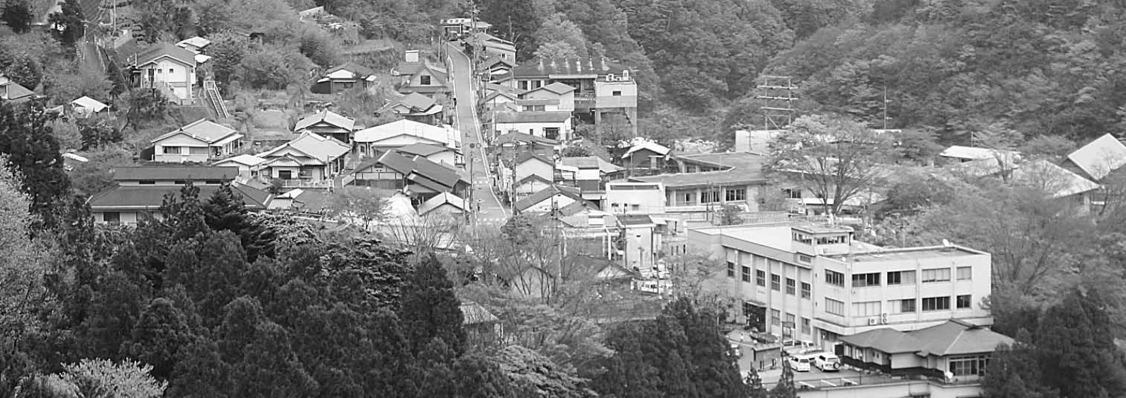
▲椎葉村役場周辺の風景