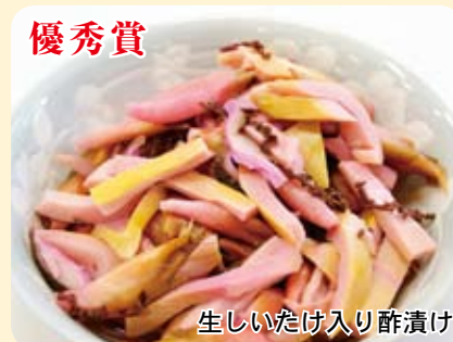
生しいたけ入り酢漬け