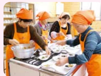
「食改さん」が調理実習で作りました(10月16日)