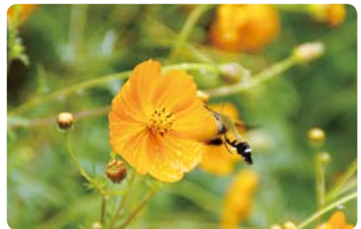
▲コスモスの蜜を吸うオオスカシバ（9月28日・松木）