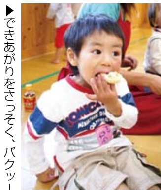
▶できあがりをお楽しみ！

秋と言えば、食欲の秋。秋の味覚といえば… 「やっぱり、栗！」と言う人も多いのでは。椎葉村では栗のあんを使った「栗まんじゅう」がよく作られます。地区や家庭ごとに砂糖や塩の加減が違う、あまくておいしいお袋の味。今年はまだ食べられましたか？