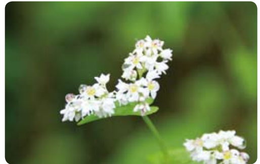
▲水滴を包み込んだ小さな花びら。富どの亭前のソバの花（9月28日・古枝尾下）