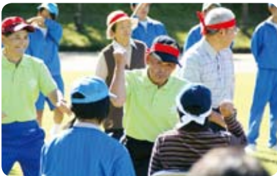
▲「じゃんけん ポンッ！」団技「国盗り物語」は4連勝でポイントゲット

山々に響く大声援。全校児童5人の不土野小学校が、公民館と合同で秋季大運動会を行いました。この日はあいにくの雨。途中から場所を体育館へと移動しましたが、工夫を凝らした楽しい競技に、会場は笑顔と笑い声に包まれました。(9月28日)