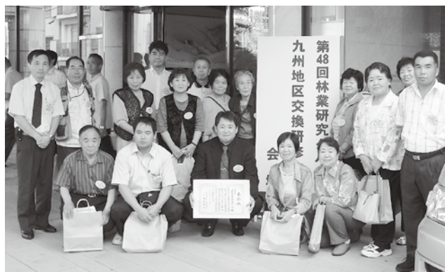
▲県代表として九州大会で活動発表を行った林研グループのみなさん（9月9日・長崎市）

椎葉村と諸塚村間の交通アクセスを向上させる国道327号線古園2号トンネルが開通しました。このトンネルは、県が平成9年度から整備を進めている古園バイパス（全長3.1キロ）の一区間。全長972メートル、車道幅員6メートル（2車線）で、総事業費は18億円。これまでの古園第一隧道は車両の高さ制限（3.5メートル）があり、大型トラックは五ヶ瀬町から国見トンネルを経由する必要がありましたが、今回の開通で高さ制限は撤廃され、時間も短縮されました。