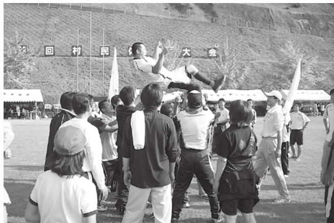
▲公民館長と体育部長を胸上げして優勝を喜ぶ黄団 (松尾公民館)