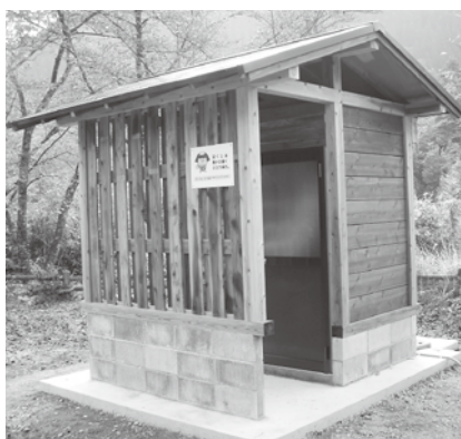
▲整備された公衆トイレ