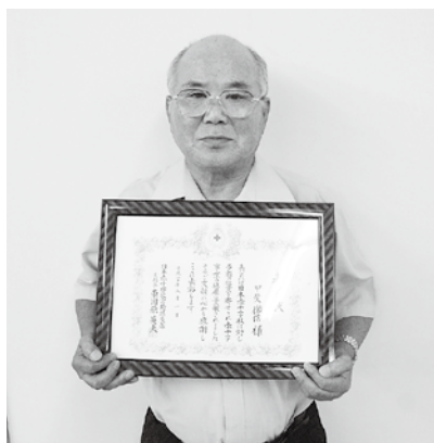
日本赤十字社 宮崎県支部長表彰 【多額社資納入者表彰】