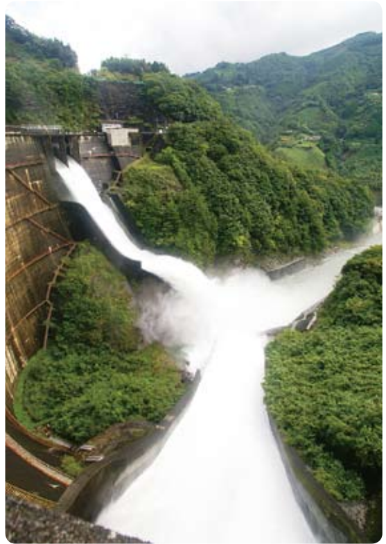
▲台風の影響で数日前から降った雨。満水になり、勢いよく放水をする上椎葉ダム（10月1日）