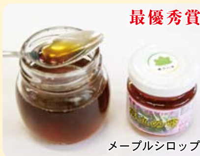
メープルシロップ