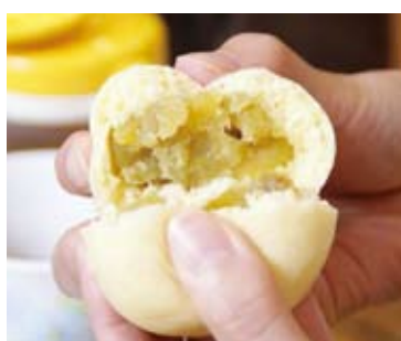
▲栗あんがびっしり詰まった「栗まんじゅう」