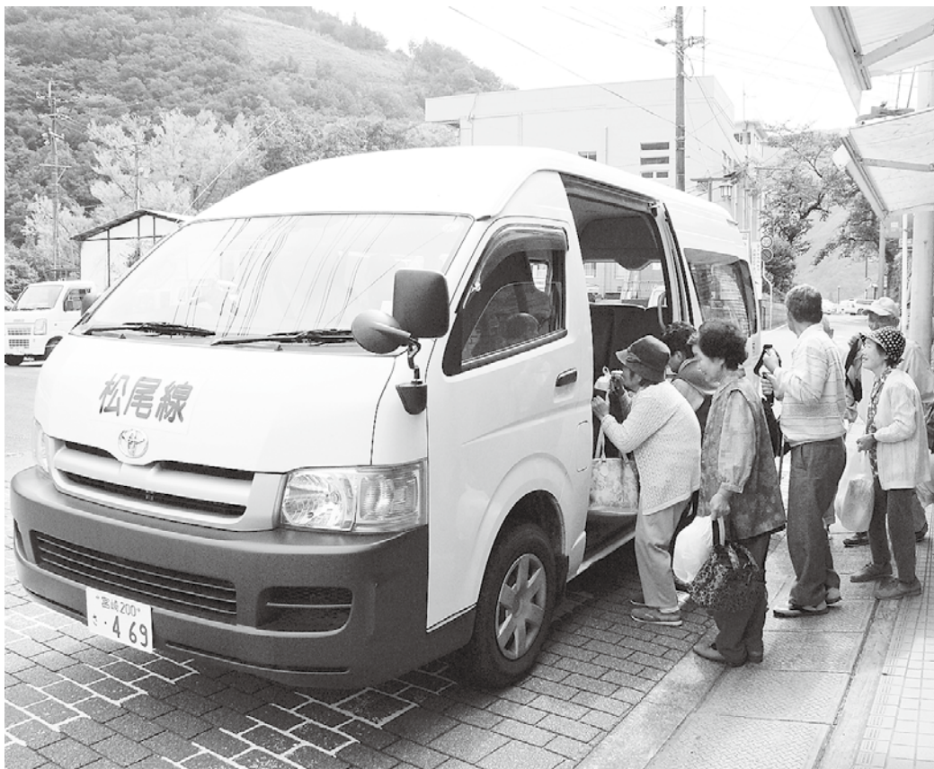
▲大幅な運行の見直しが行われた村営バス。10月より新たに運行が始まった松尾地区でも、多くの方が利用されています。(10月3日・上椎葉 中園本店前)

10月17日に開かれた臨時議会で、道路の維持工事費として一億円の追加補正が審議され、可決されました。この予算は、村民の通行の安全対策と、公共工事による雇用対策として、主にバス路線を中心とした道路整備に活用されます。