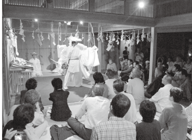
守り受け継がれてきた椎葉神楽