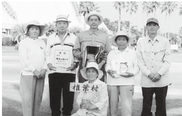
▲週2回の練習を重ね、宮崎県のチャンピオンとなった上椎葉チームのみなさん（10月8日・県総合運動公園）

インフルエンザを予防 冬になると流行する伝染病。症状は急激な発熱や関節痛など。毎年、計画的に予防接種を実施します。