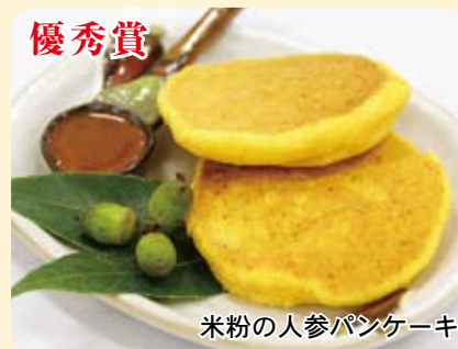
米粉の人参パンケーキ