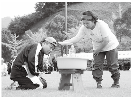
▲ゆっくり急いで水運び。団技「節水にご協力？」

晴天広がる秋空の下、どっと集まり700人。村内10地区6団に分かれ、心地良い汗かきながら、コミュニケーション図ります。勝敗競うだけでなく、健康増進目指します。この日に備えて練習を積み、一等賞を目指す人。大会前に焦って練習、筋肉痛で走る人。真剣勝負の徒競走、声援飛び交うリレー走、笑顔広がる団技もいろいろ。上椎葉ダムを見下ろす場所です。「スポーツの秋」を楽しみました。