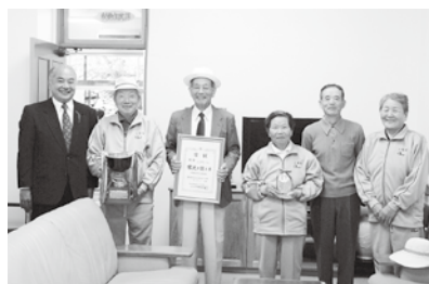
▲村長への優勝報告（10月20日）

県内の代表44チームが参加して行われた第7回さんさんクラブ宮崎スポーツ大会のゲートボール競技において、本村代表として出場した上椎葉チームが見事優勝を果たしました。