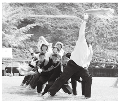
▲元気に踊った赤団（尾向）の応援団

晴天広がる秋空の下、どっと集まり700人。村内10地区6団に分かれ、心地良い汗かきながら、コミュニケーション図ります。勝敗競うだけでなく、健康増進目指します。この日に備えて練習を積み、一等賞を目指す人。大会前に焦って練習、筋肉痛で走る人。真剣勝負の徒競走、声援飛び交うリレー走、笑顔広がる団技もいろいろ。上椎葉ダムを見下ろす場所です。「スポーツの秋」を楽しみました。