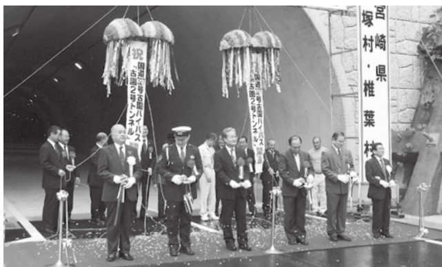
▲古園2号トンネルの開通を祝いテープカットとくす玉割りが行われた開通式（10月10日・諸塚村七ツ山）