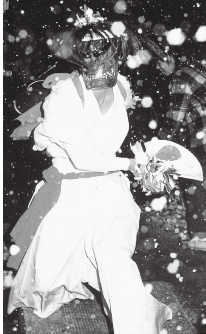
向山日添神楽「願成就の舞」