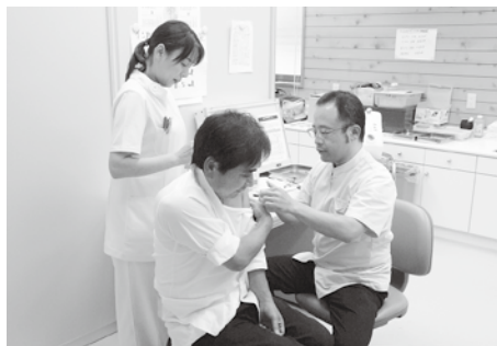
▲村民の約4割が受ける予防接種。事前の申し込み者は1,172人です。（10月22日・保健センター）

椎葉村女性のつどい 婦人会の会員による学習会。記念講演と癒しのコンサート「ハーモニカ演奏」が行われました。