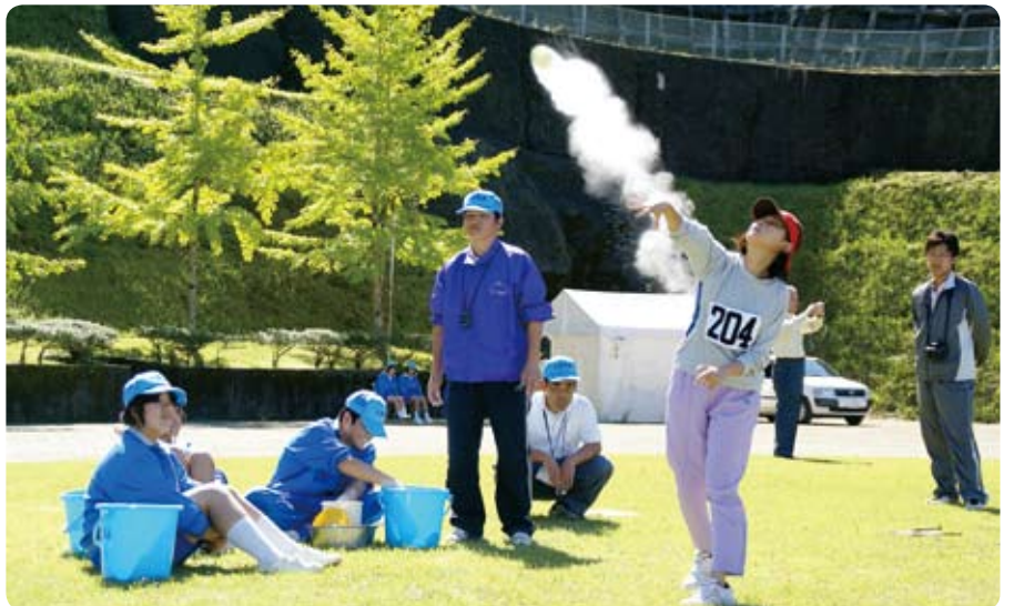
▲42人が参加したテニスボール投げ。落下地点が分かるように付けられた粉が尾を引きながら飛んでいきました。